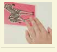
熊木 夏穂 会社名:株式会社 辻洋装店 アトリ工務(東京)