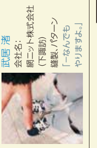
武居 渚 会社名:ネット株式会社 (下諏訪) 縫製、パターン 「-なんでも やりますよ。」