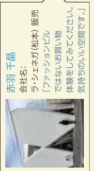
赤羽 千晶 会社名:ラ・シエネガ(松本)販売 「ファッションビルではないお買い物体験をしてみてください。気持ちのいい空間です。」